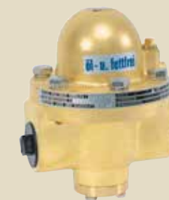
Posebni regulatorji tlaka