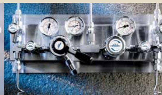
Regulacijska odvzemna mesta