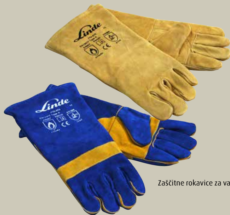
Zaščitne rokavice za varilce