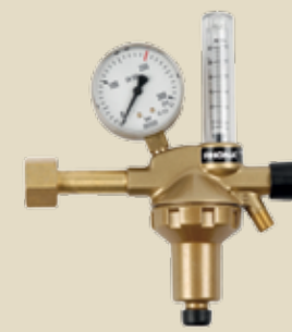
Reducirni ventili z merilcem pretoka