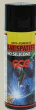
Sprej proti varilnim obrizgom za varilno pištolo