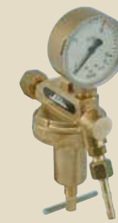
Regulacijska odvzemna mesta