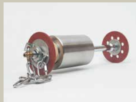
Priprave za zaščito korenkega varka