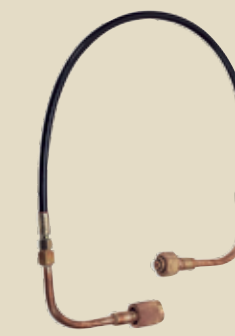
Visokotlačne gibljive cevi