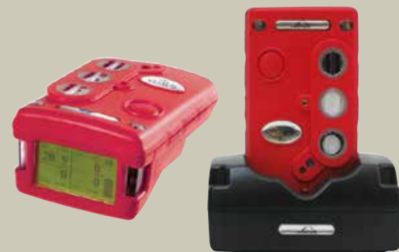
Detektor pomanjkanja kisika in različnih plinov