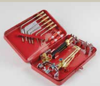
Plamenski gorilniki in rezalniki