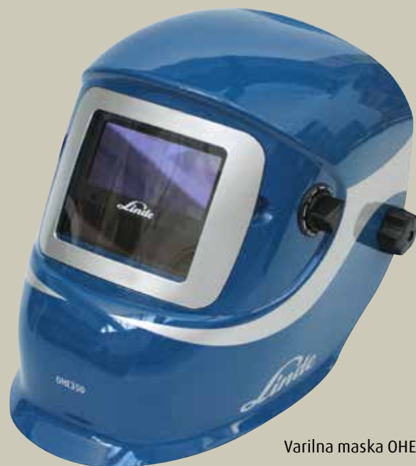
Varilna maska OHE 350