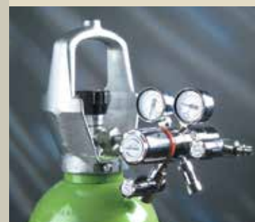
Reducirni ventili z manometrom