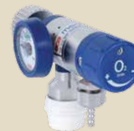
Reducirni ventili z regulatorjem pretoka