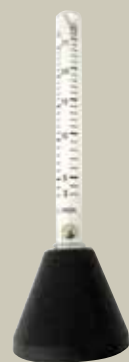
Merilec pretoka za varilno pištolo