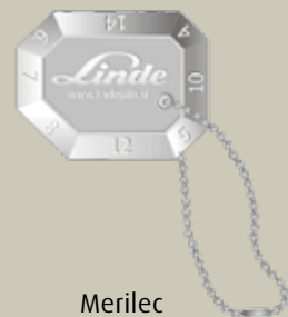
Merilec kotnih spojev