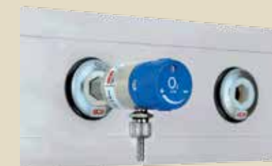
Regulacijska odvzemna mesta